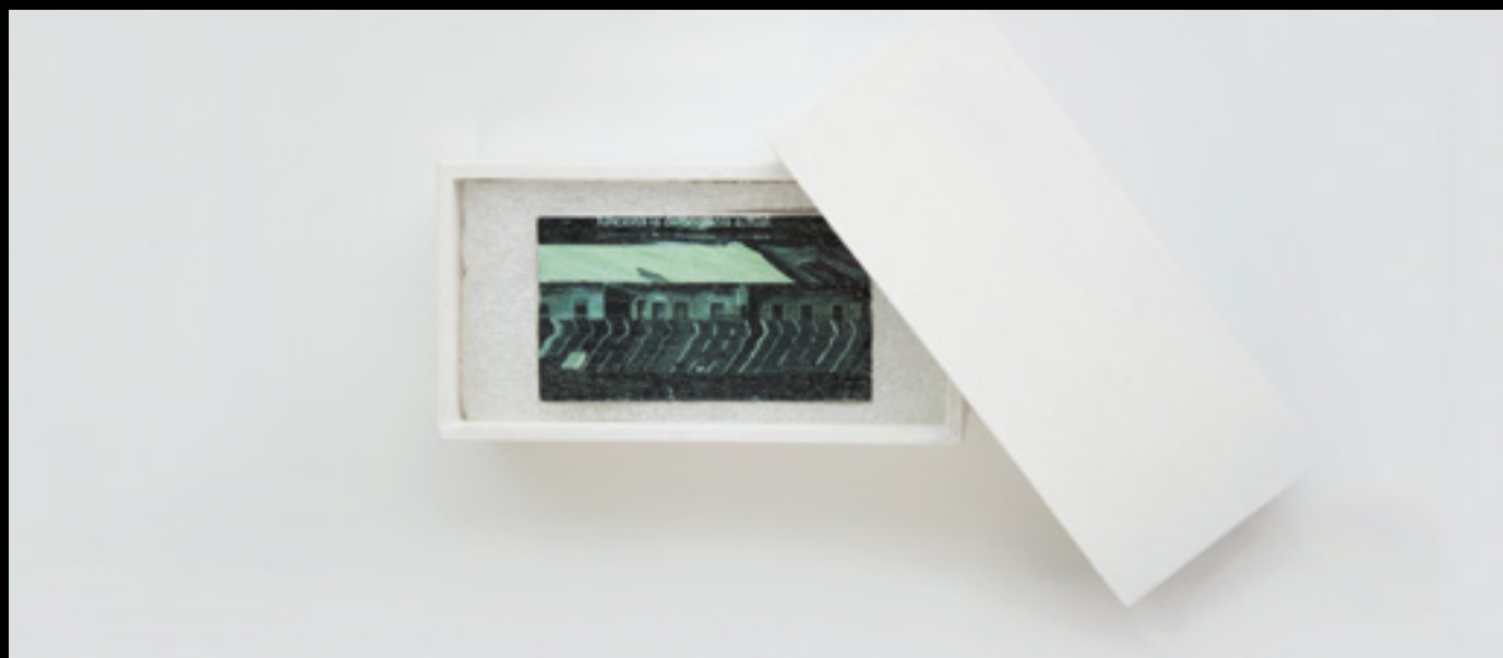
Priscila Ramal. "Corpus Delicti" Técnica mixta