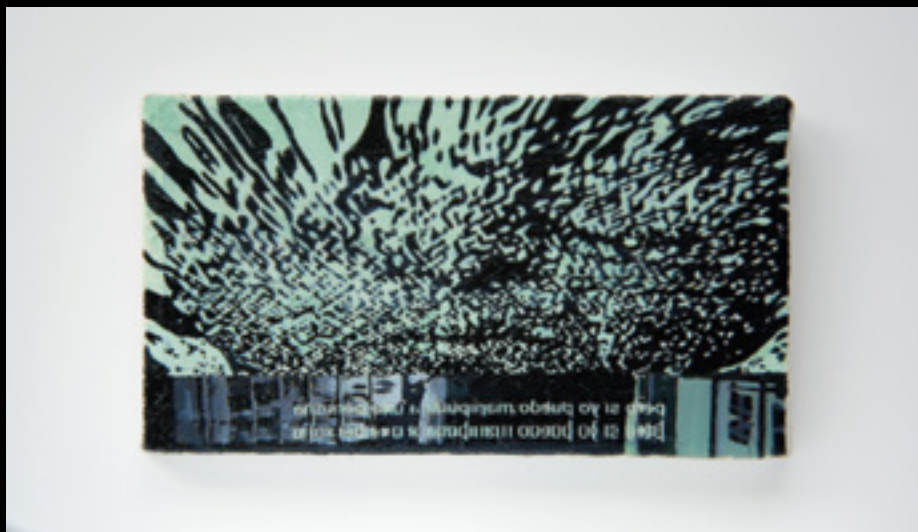
Priscila Ramal. "Corpus Delicti" Técnica mixta