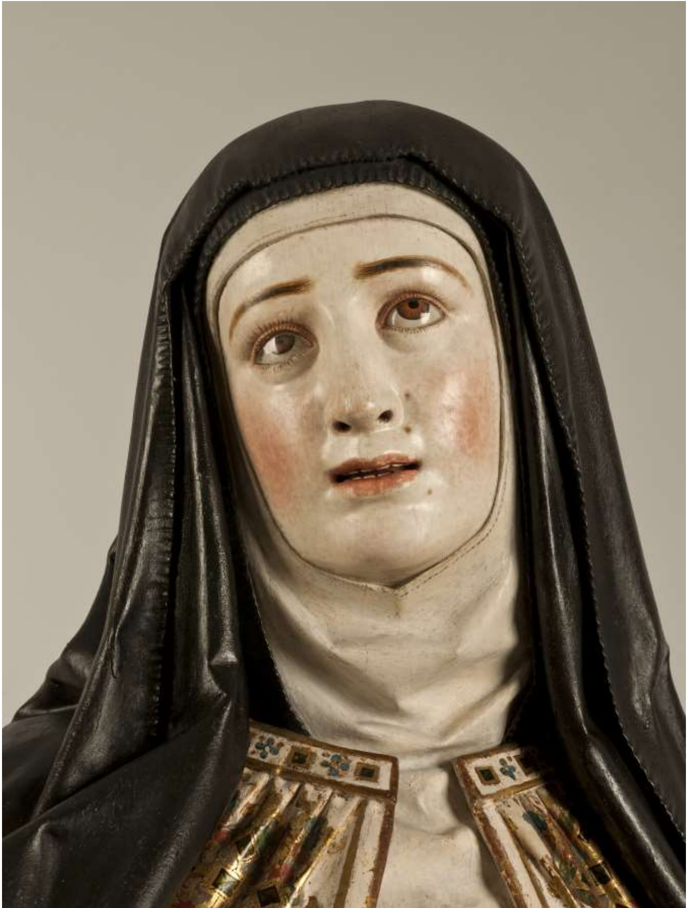
Santa Teresa de Jesús Gregorio Fernández