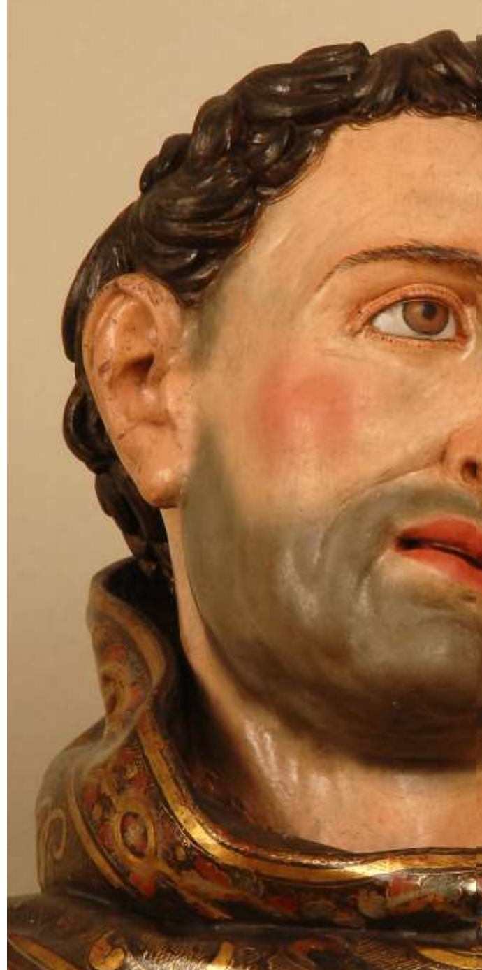
San Antonio de Padua con el Niño Juan de Juni

Sus volúmenes y policromías se trasladan al lienzo a través de unas pinceladas cargadas de materia, que bien podrían retratar a un personaje de nuestro tiempo.