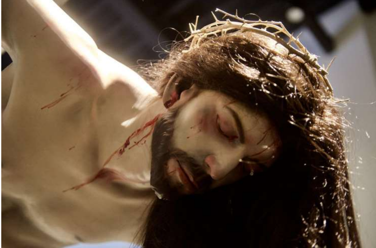
La Fuente Santiago Ydáñez