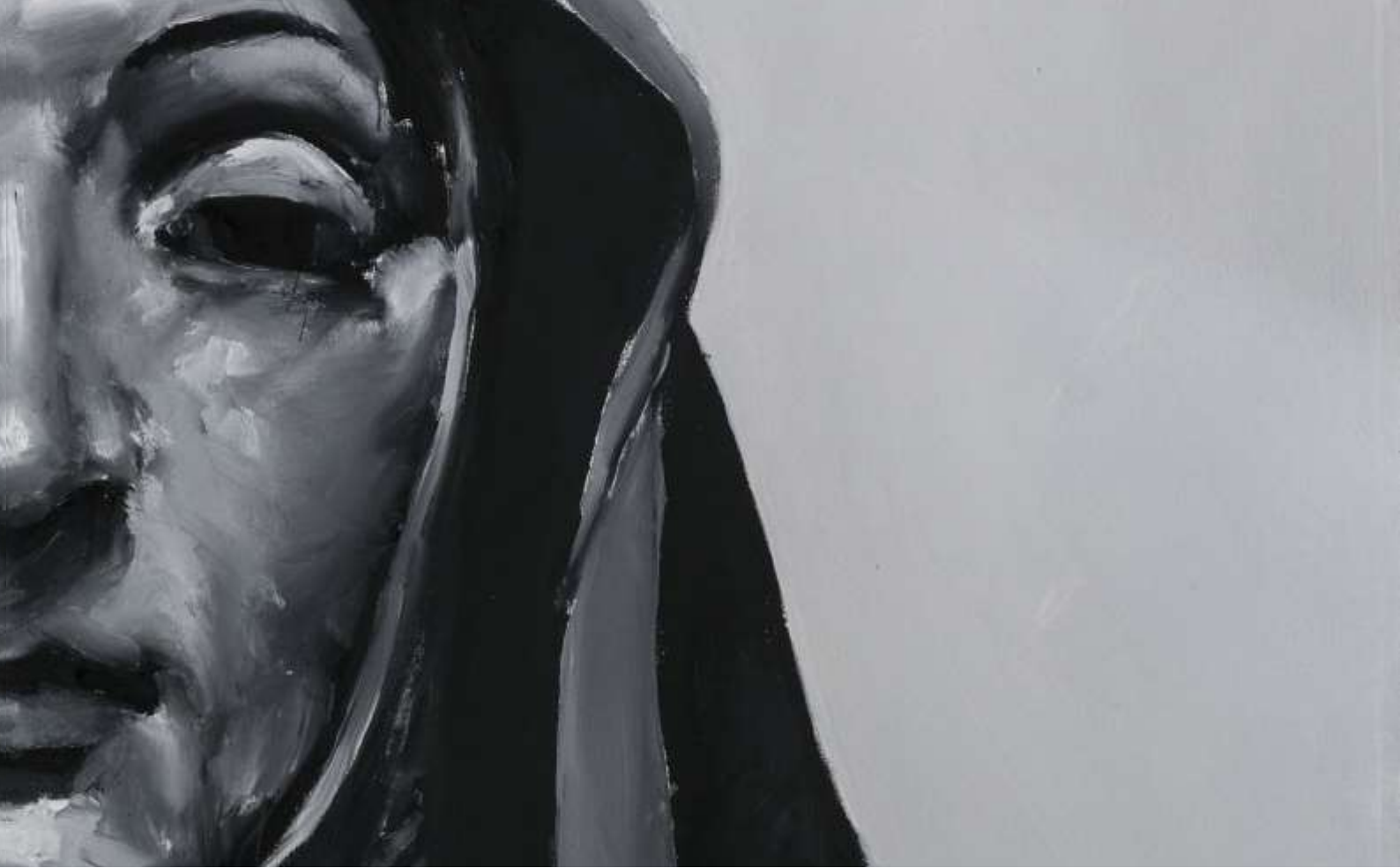
Sin título Santiago Ydáñez

antiguos en los que ha introducido pequeñas pinturas al óleo, o materiales que permiten la producción seriada, como el bronce o la terracota.