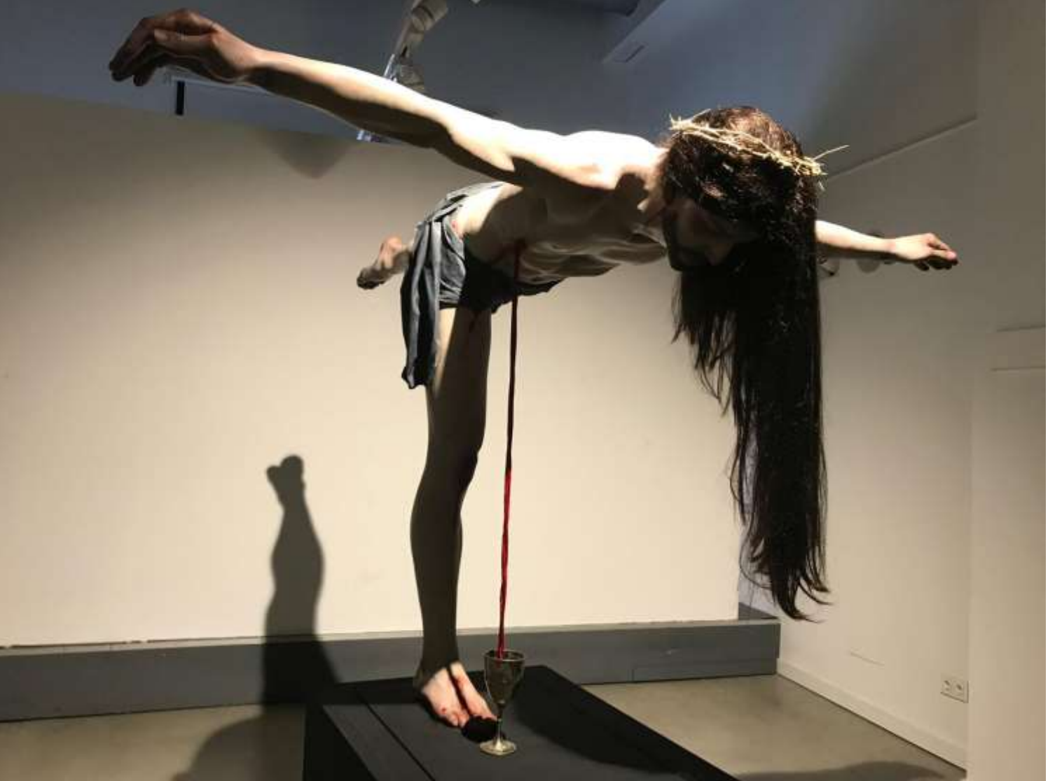
La Fuente Santiago Ydáñez