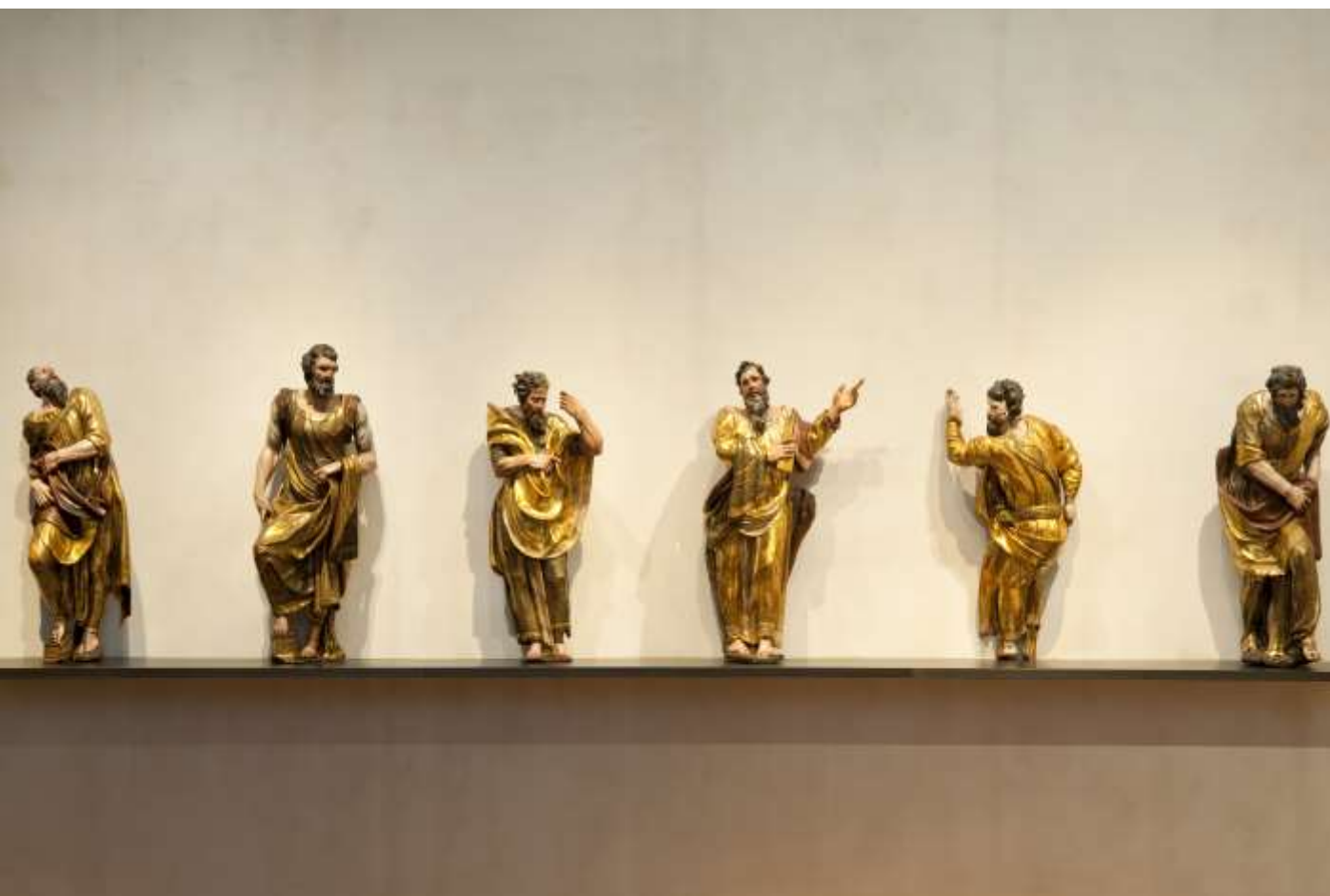
Profetas del retablo mayor de San Benito el Real Alonso Berruguete