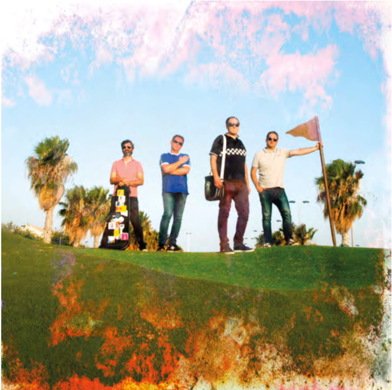
The Yellow Melodies