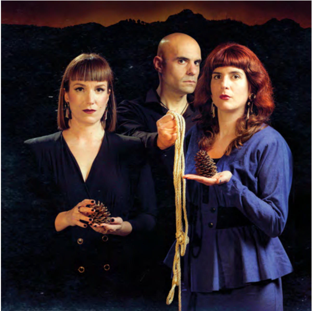
Sudores de Muerte